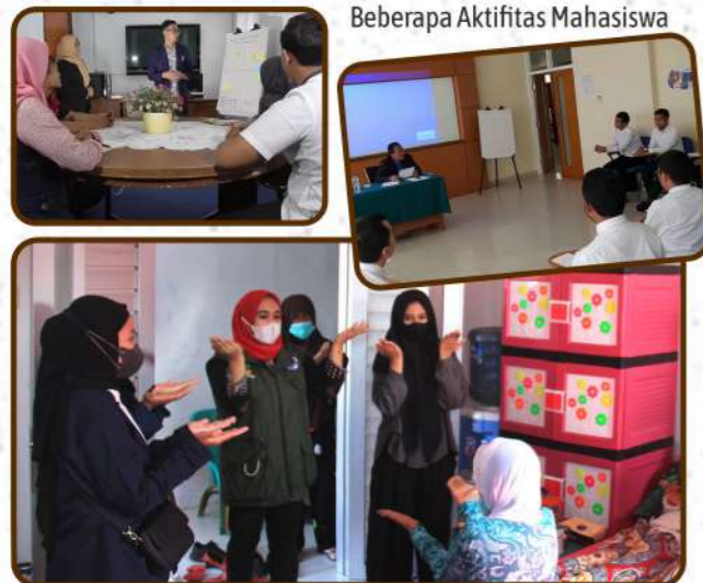
Beberapa Aktifitas Mahasiswa